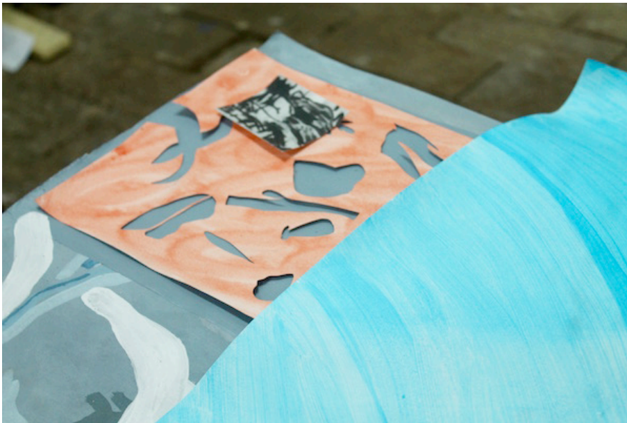
Fotografía de proceso de Jaclyn Tobía

IMÁGENES: Para imágenes de prensa comunicarse con Andrés Monzón al 310 443 0408